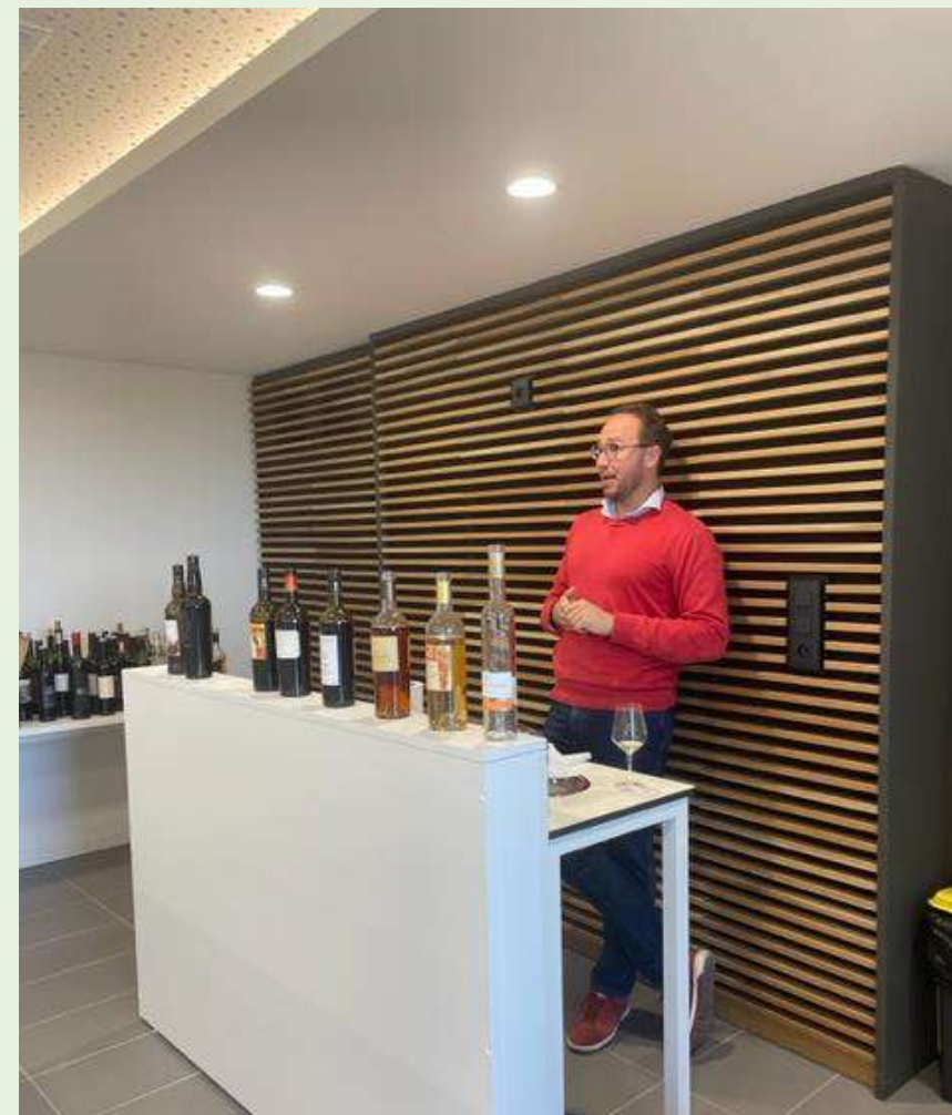
Laboratoire d'analyse sensorielle

Les salles sont également adaptées pour accueillir des animations et des événements toujours en lien avec la filière vitivinicole.