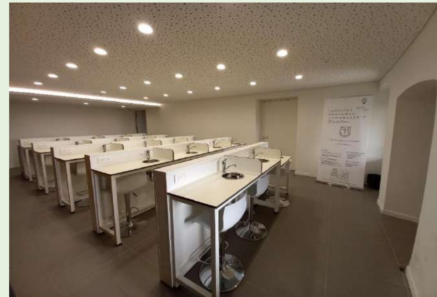
Laboratoire d'analyse sensorielle