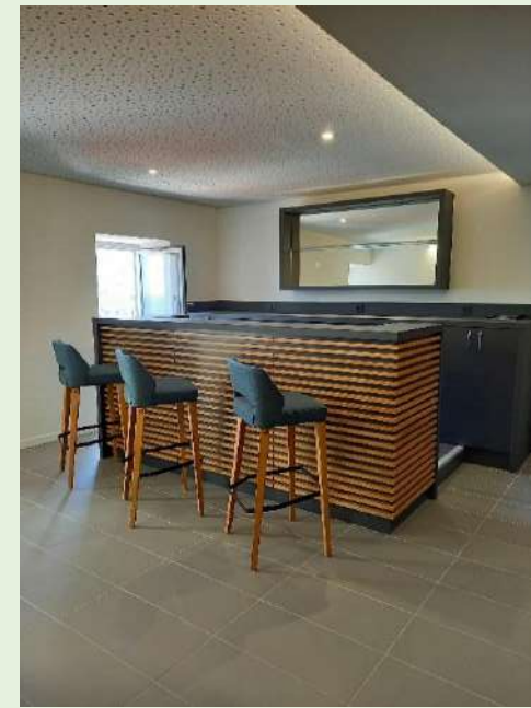
Bar de mixologie