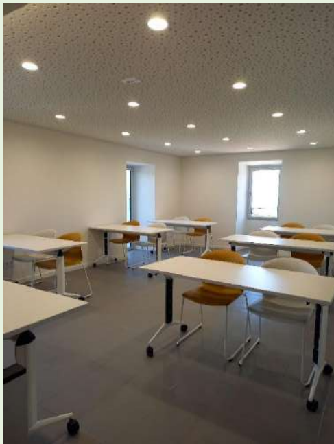
Salle de cours