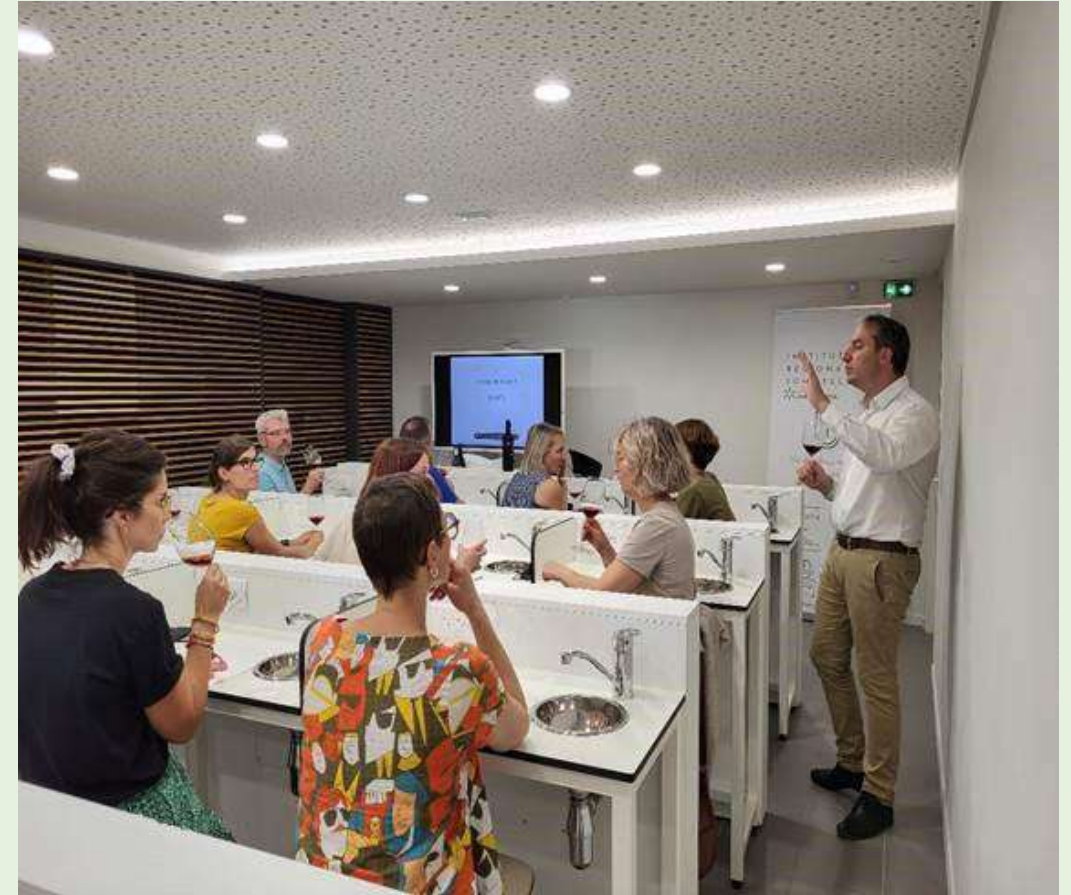
Laboratoire d'analyse sensorielle