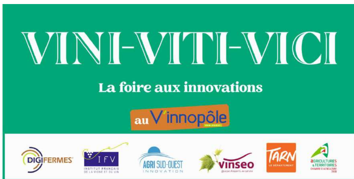
Exemple : Bâche annonçant l'évènement à l'entrée de la manifestation

Cet évènement, unique pour la filière Viti-Vinicole, ne pourrait être organisé sans le soutien logistique et financier du département du Tarn et de la Région Occitanie via le FEADER Communication.