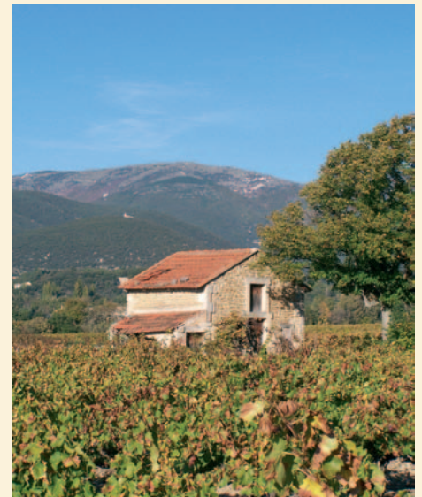
Cabanon à préserver

Editions Chamina 35 rue du Pré la Reine 63028 CLERMONT-FERRAND Cedex 2 Format 14 x 21 cm - 144 pages en couleur. Prix : 15,00 €