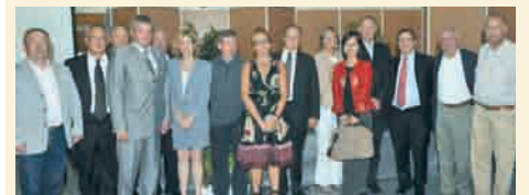
Les élus du Vin et les participants aux débats