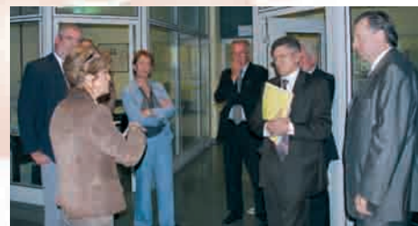
Visite du laboratoire de Suze la Rousse par le préfet de région.