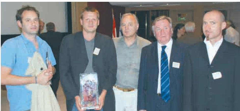
Remise du prix 2008