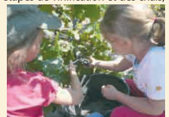
Vendanges à l'école

Les Vignerons Coopérateurs de Vaucluse ont développé « Ecoles en vendanges », un partenariat avec des écoles primaires pour faire redécouvrir notre patrimoine viti-culturel aux nouvelles générations. Vendredi 26 septembre, près de 200 enfants des écoles de Caumont sur Durance et Morières les Avignon ont vécu au rythme des vendanges: au programme, récolte des grappes avec les viticulteurs, séance de dessin dans la vigne, découverte des étapes de vinification et des chais, goûter à base de raisins noirs et blancs et de jus de raisin. Des actions sont menées dans d'autres caves: Cave de Beaumont du Ventoux, Cave de Rasteau... Des BD pédagogiques « Grapillou ou l'aventure d'un grain de raisin » sont mises à disposition des professeurs d'école et des enfants. Pour le personnel enseignant, Ecoles en vendanges permet de travailler tout au long de l'année sur la thématique de la viticulture en établissant des ponts avec les matières comme l'histoire, la géographie, la biologie, le français, les travaux pratiques...