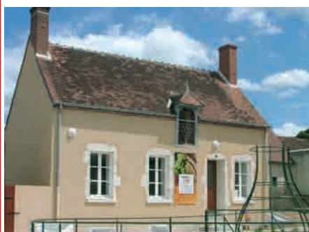
La Villa Quincy