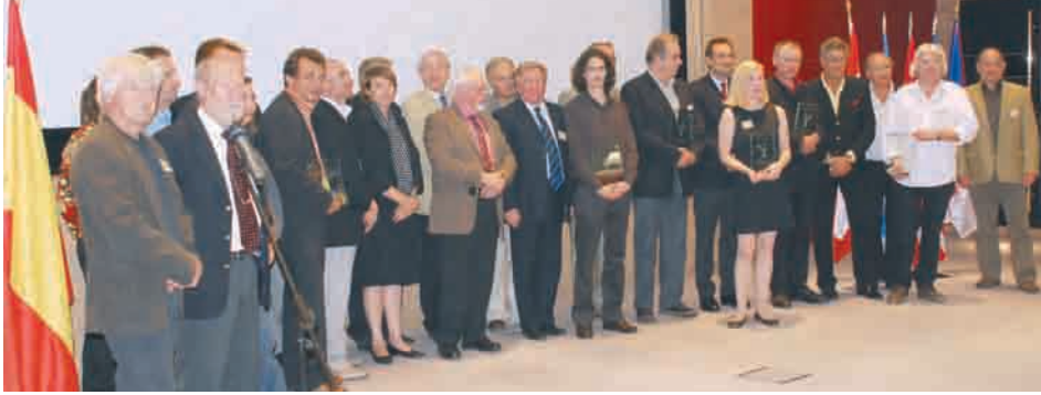
Les lauréats 2008

Le 15 e Festival international des films documentaires sur la vigne et le vin a eu lieu à Gruissan en Languedoc-Roussillon. 82 films en provenance de 12 pays étaient en compétition. Le président du Grand Jury du 15 e festival CEnovidéo était Michel LEEB, acteur, producteur et réalisateur. Cette année, le Trophée Cep d'Or du Grand Jury a été remis au film «L'espoir quand même» un film réalisé par Patrice Rolet (System TV production).