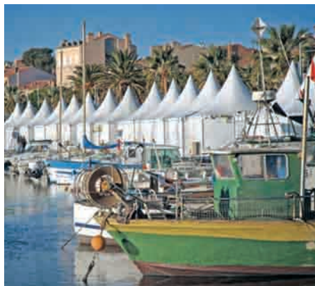
La fête du millésime