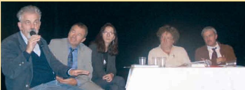
Université de la vigne et du vin