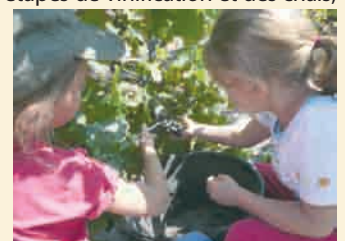
Vendanges à l'école