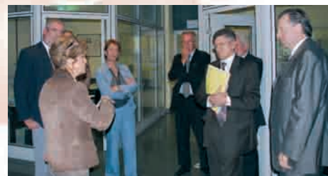
Visite du laboratoire de Suze la Rousse par le préfet de région.